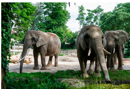
Die Elefanten des Zollis

Am Freitagnachmittag beginnt der Anlass mit einer Zolli-Führung, welche die Teilnehmenden unter anderem zum Futterhof, zum Elefantenhaus und zum Vogelhaus führen wird. Danach geht es über in das Abendprogramm