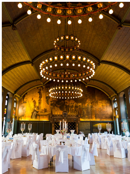
Restaurant Safran Zunft in Basel