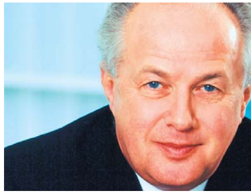
Praktizierender Katholik: Roche-Lenker Franz Humer versteht sich aber nicht als «Gutmensch».